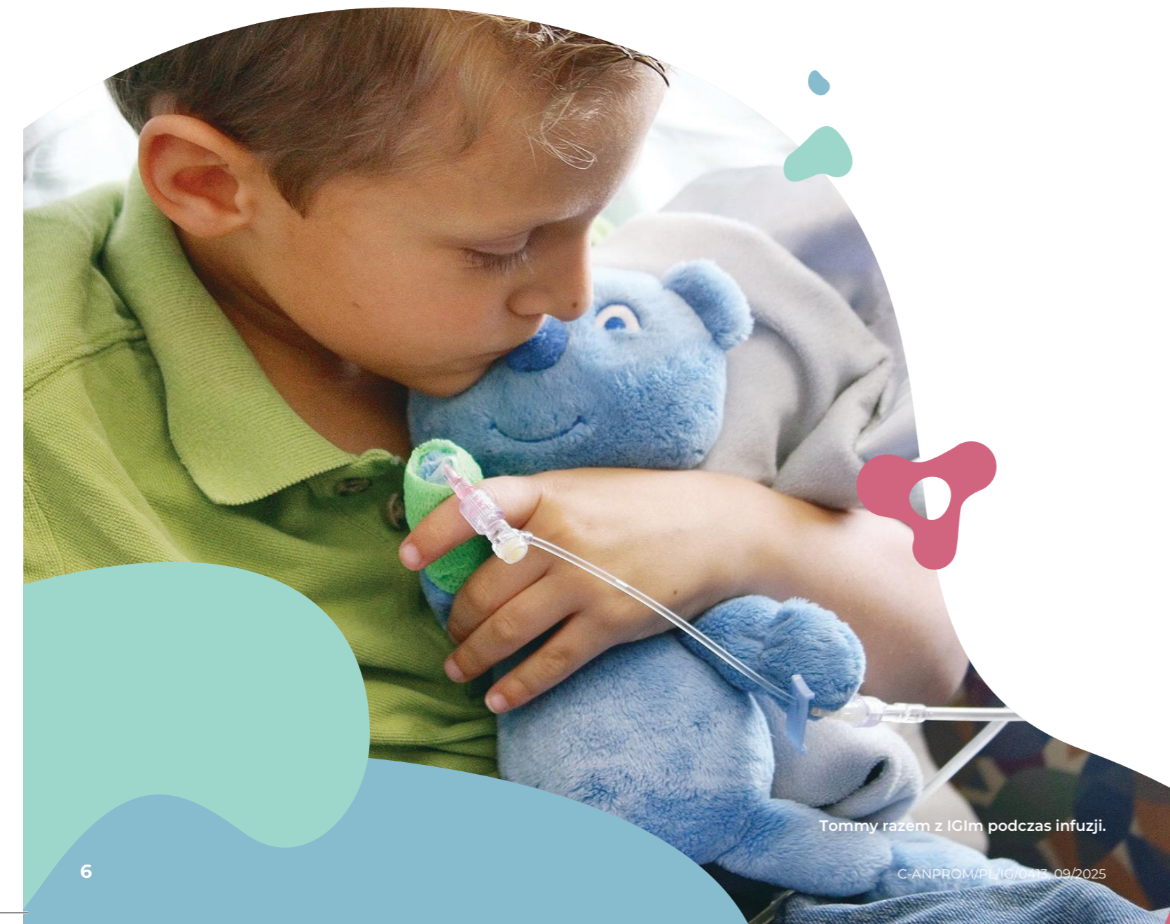
Tommy razem z IGIm podczas infuzji.