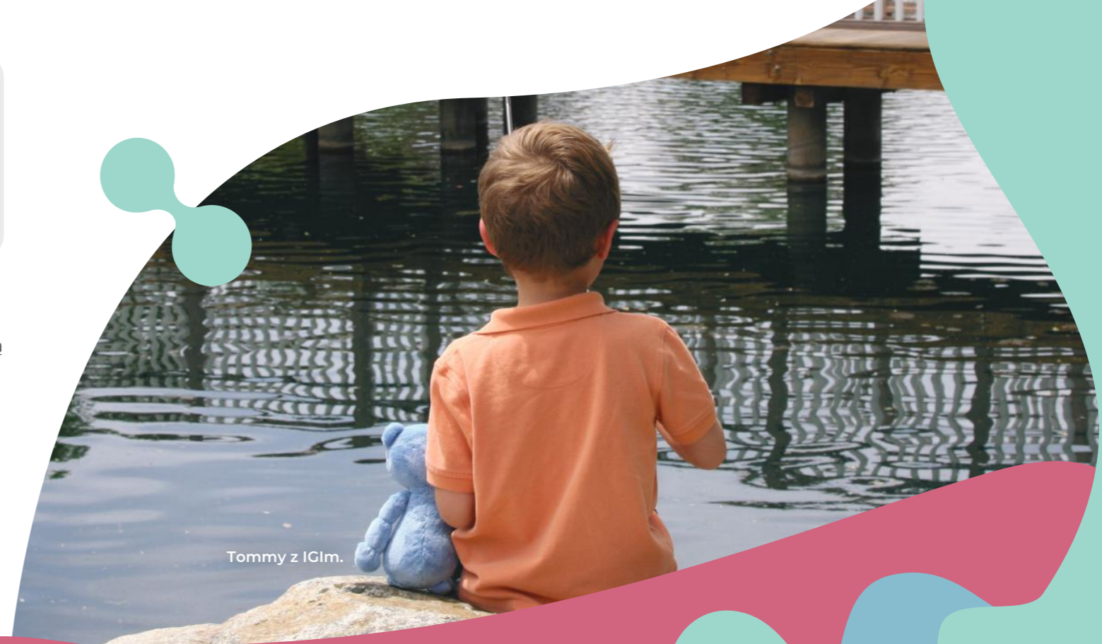
Tommy z IGI.

Miękki, pluszowy fantom IGI ma zaznaczony pępek oraz kończyny z łokciami i kolanami, aby zarówno dzieci, jak i ich bliscy mogli wskazywać różne części ciała pluszowej maskotki IGI podczas ćwiczeń z podawania infuzji i zaznaczać bolesne miejsca.